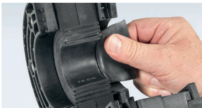
HSI 150-DG : repérage facile des segments rattachés