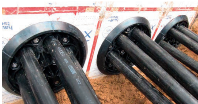
Étanchéification de câbles basse tension avec HSI 150-DG-6/10-36