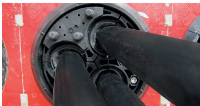
Protection pour plaques de presse HSI 150-PA-3/24-54