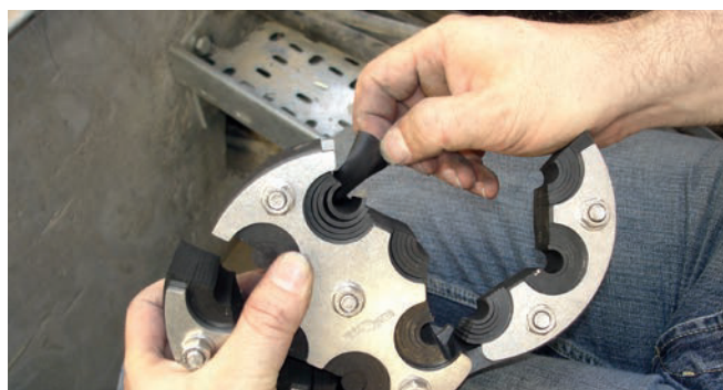
HRD 150-SG – 6/8-35 – adaptation flexible au diamètre extérieur du câble