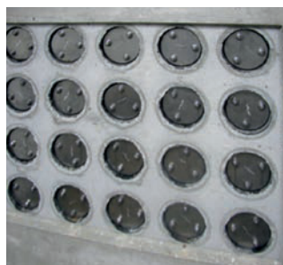
FZR 100/240 Étanchéification canalisation