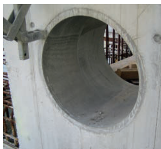
FZR 400/300 Site de montage station d'épuration